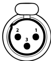
DMX - ВЫХОД XLR-male

Pin1: Экран Pin2: Отрицательный сигнал (-) Pin3: Положительный сигнал (+)