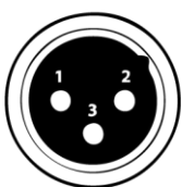
DMX - ВХОД XLR-female

Pin1: Экран Pin2: Отрицательный сигнал (-) Pin3: Положительный сигнал (+)